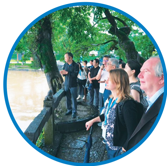
↑中外学者沿灵渠步行，近距离感受古人治水的智慧与精湛工艺。