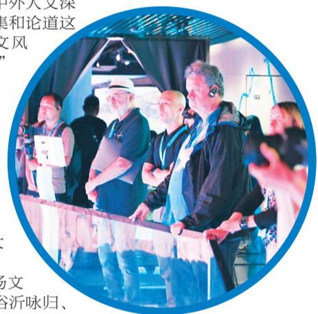
↑中外学者聆听灵渠的前世今生。