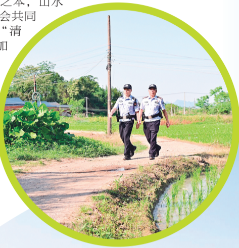
↑雁山警方在田间地头开展常态化白天巡查。