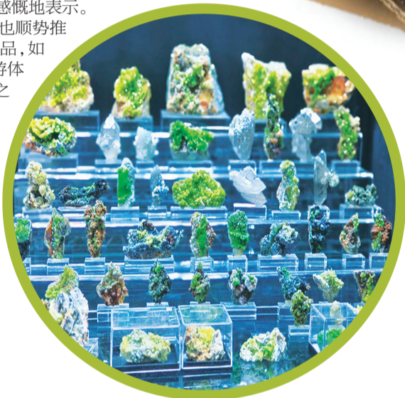
↑在桂林街巷的石板路上,能“偶遇”到各种海洋生物化石。

与此同时,我市近年来也顺势推出了一批地学旅游路线产品,如“追寻大象游象山”地学旅游体验活动、上月山谷地溯源之旅、南溪水事拓展运动之旅等,这种集观光游览、科考研学、探险求奇、康乐养生、休闲度假为一体的旅游方式受到了许多游客欢迎。而通过研学旅游也推动了地学科学知识普及,让更多人看到不一样的桂林山水,把“文旅+”这篇文章写得更开阔、更生动。