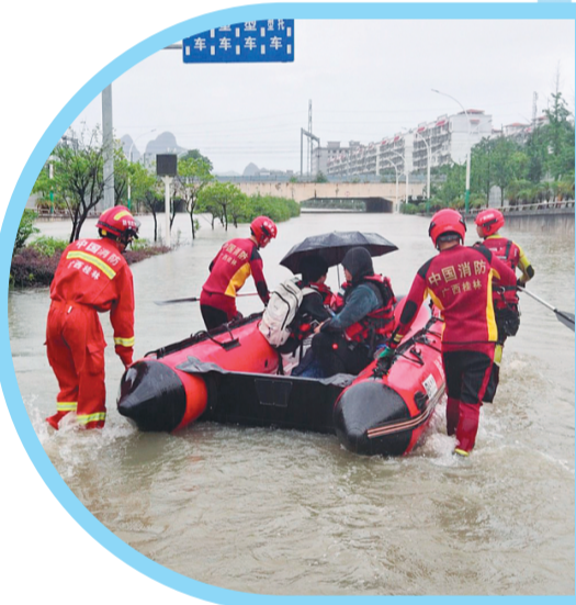
↑在秀峰区中隐路，消防救援人员用橡皮艇护送考生。

路执勤时接到考生及家属求助——积水导致通行中断，考生被困路边。民警当即安抚其情绪，安排考生搭乘警车，避开拥堵积水路段全力疾驰，于7时55分将考生安全、准时送达桂林中学考点。