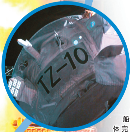
◀5月11日在北京航天飞行控制中心屏幕上拍摄的天舟十号货运飞船和空间站组合体完成交会对接的画面。

5月11日8时14分，长征七号运载火箭托举着天舟十号货运飞船在文昌航天发射场腾空而起。约10分钟后，飞船与火箭成功分离并进入预定轨道，随后成功对接于空间站天和核心舱后向端口。