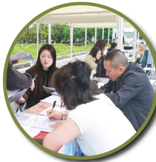
↑ 参展商签到处已有商家到达签到。

而当夜幕降临，精彩仍将持续：17日晚为“民族之夜盛典”，18日晚为“潮流青春·北大人原创音乐汇演·巴西要塞乐团演出”，19日晚则为“桂林有戏——地方戏曲展演”，市民游客可在此尽享全天候的狂欢体验。