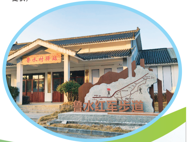
→鲁水村红军步道打卡艺术装置。

记者李思静 通讯员刘运和 黎冬