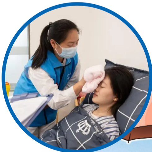
↑ 2025年4月19日，全国首场长期照护师（五级）认定考试在江苏南通举行。