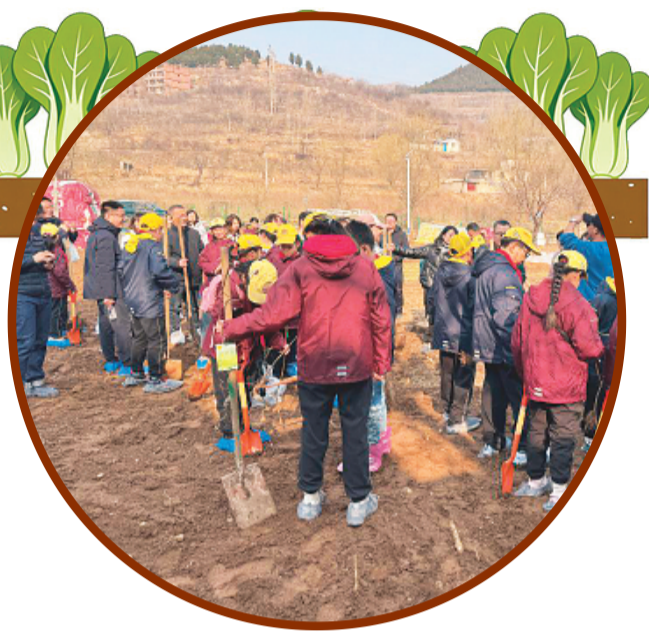
↑3月15日，学生在济南初禾农场参加研学活动。

土地使用是否合规是能否持续运营的关键之一。以“章灵丘的田园”为例，历城区农村产权交易中心