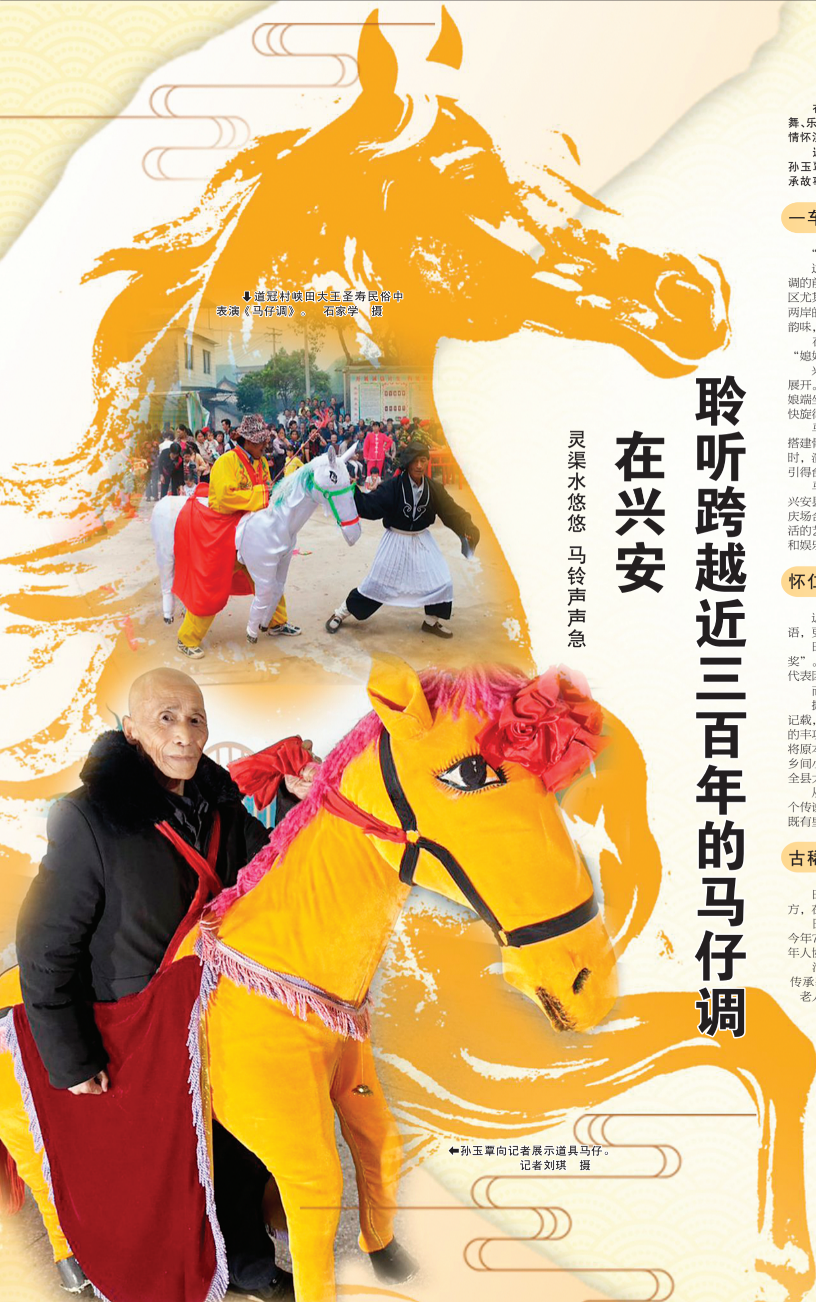
↓道冠村映田大王圣寿民俗中表演《马仔调》。