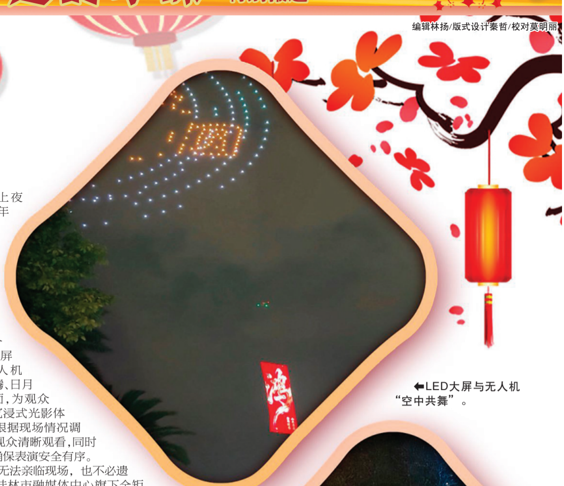
◀LED大屏与无人机“空中共舞”。