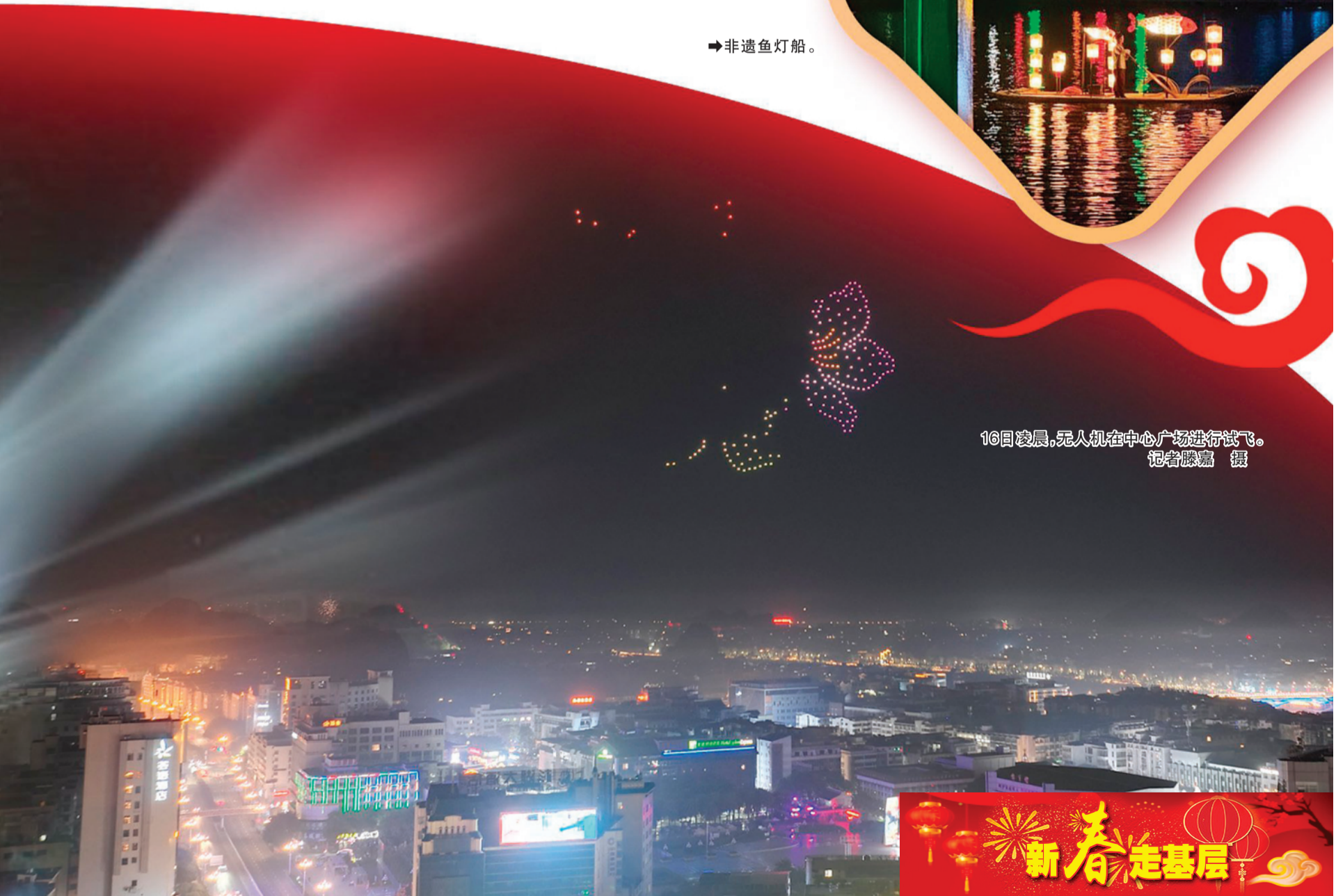
16日凌晨，无人机在中心广场进行试飞。