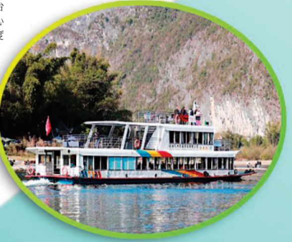
游客乘船游览漓江精华段。