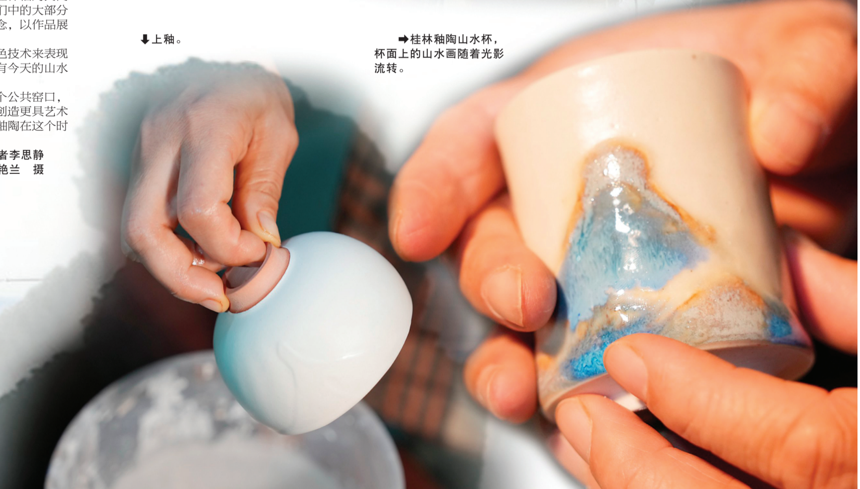
→桂林釉陶山水杯，杯面上的山水画随着光影流转。