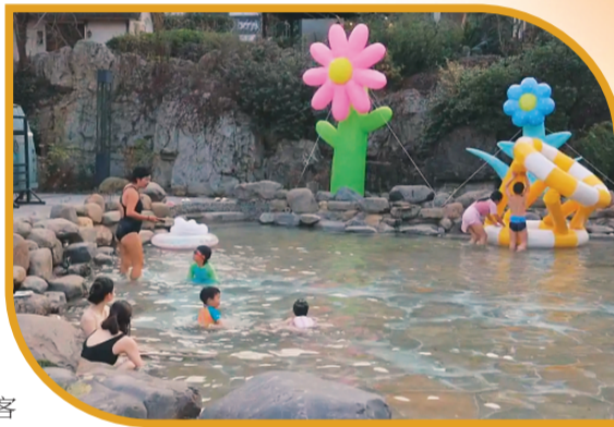
↓ 12月28日，游客在十畝温泉旅游度假区游玩。（资料图片）