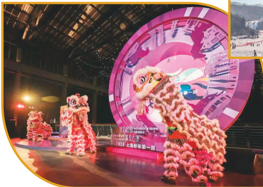
← 12月29日拍摄的上海市徐汇区西岸梦中心跨年光影秀彩排现场。（资料图片）