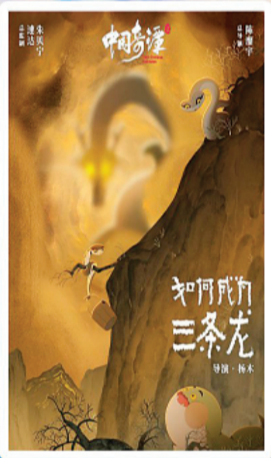
↑《如何成为三条龙》单张海报。

列化、多元化内容孵化模式，为动画创作者搭建起叙事探索与美学实验的开放平台；通过衍生授权、跨界合作、实景娱乐等多元路径延伸IP价值链，逐步构建从短片开发到长线运营的生态体系。这一探索不仅丰富了中国原创动画的风格与题材维度，更为中国动画IP体系化发展提供了有益参考，助力中国动画学派在新时代实现传承与创新。