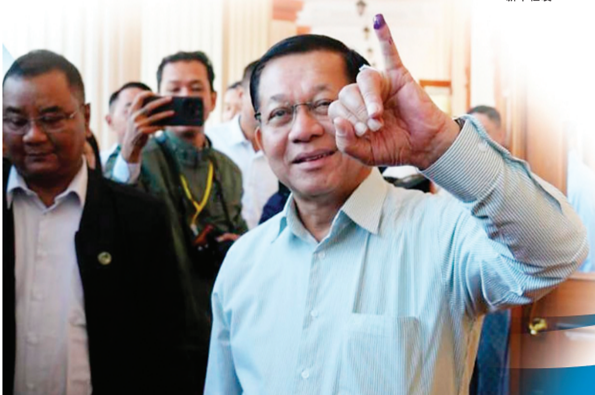
↓12月28日，在缅甸首都内比都的一处投票站，缅甸代总统敏昂莱在投票后展示蘸有墨水的手指。