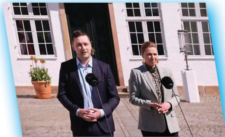
↑2025年4月27日，在丹麦哥本哈根附近的马林堡，丹麦首相弗雷泽里克森（右）与格陵兰岛自治政府总理尼尔森共同会见记者。