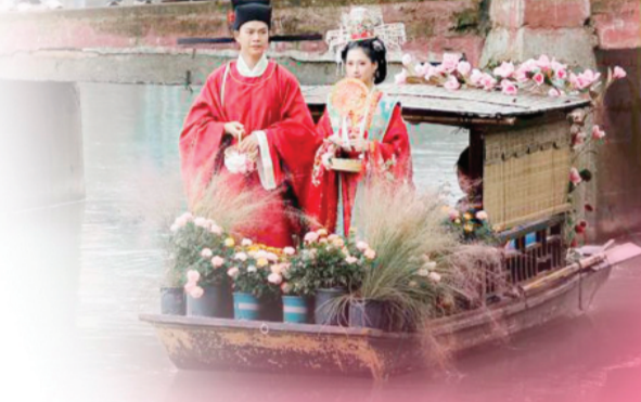
↑成都邛崃市夹关古镇举行的水上婚礼仪式。