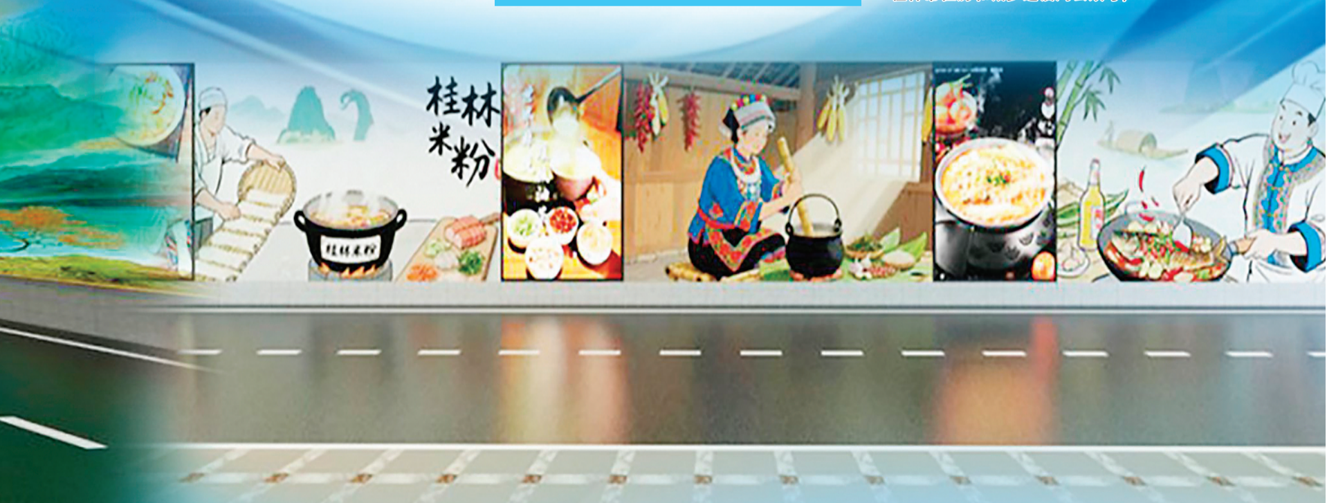
↓方案二效果图。