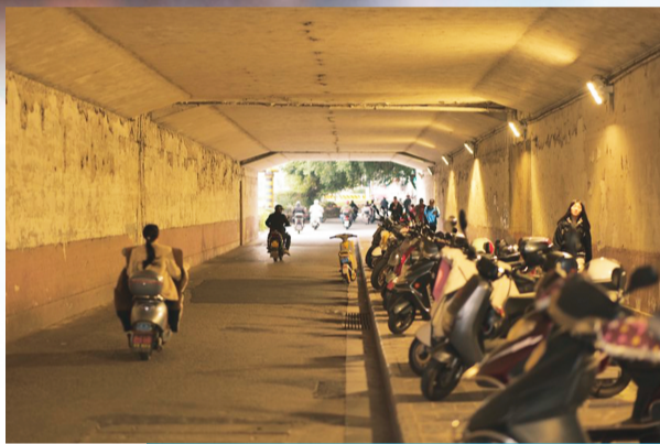
↑上海路下穿通道现状。