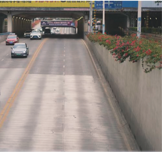
↑上海路下穿通道承载着“老桂林”的许多记忆,很多南来北往的车辆从这里经过。