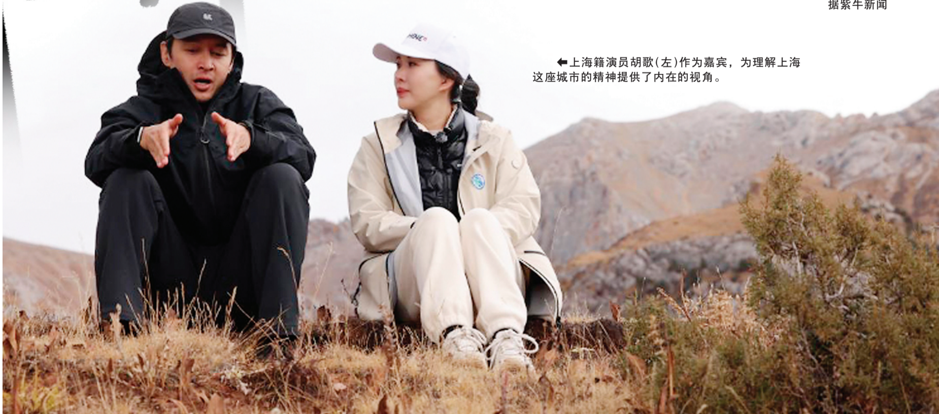
←上海籍演员胡歌（左）作为嘉宾，为理解上海这座城市的精神提供了内在的视角。