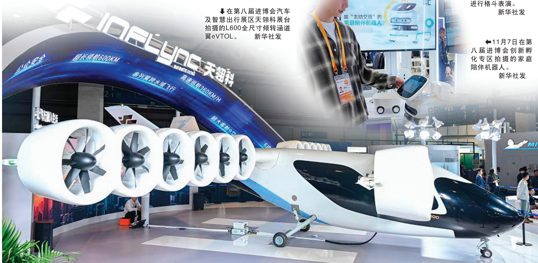
↓在第八届进博会汽车及智慧出行展区天翎科展台拍摄的L600全尺寸倾转涵道翼eVTOL。