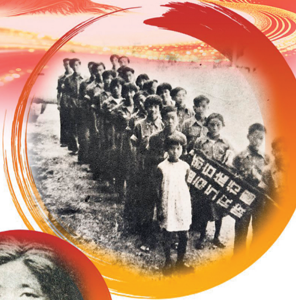
↑新安旅行团部分团员。 (资料图片)