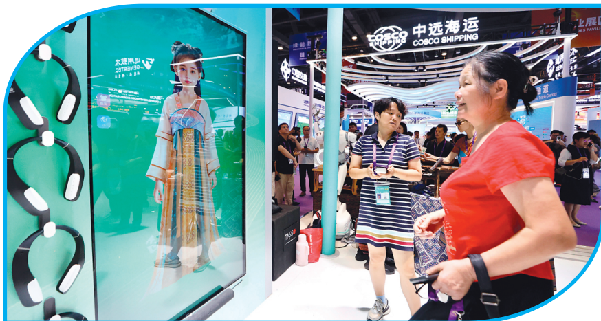
◀ 文旅新玩法，数智人“桂灵儿”向观众推荐专业的旅游线路。