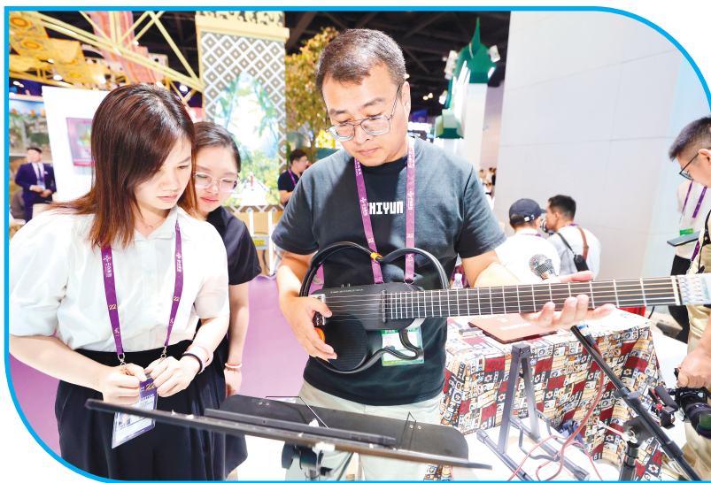
◀ AI吉他轻松玩嗨音乐。