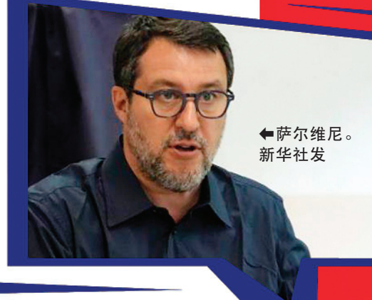
←萨尔维尼。