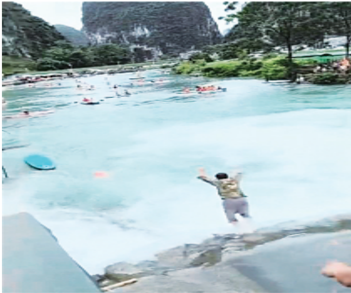
村民飞身跃入水中救人。

8月19日下午，都安瑶族自治县东庙乡弄工村吞榜天窗水域突发惊魂一幕：一名男子在划桨板时意外落水，危急时刻，多名村民挺身而出，将该男子从“鬼门关”拉了回来。