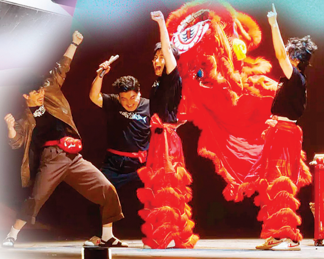
→闭幕大戏《雄狮少年》剧照。

他们挥舞画笔，在巨大的白板上泼洒墨点。那些看似随意的线条和色块，转眼间就变成了活蹦乱跳的动物：一滴墨水“啾”地绽开，化作摇头晃脑的小狗；歪歪扭扭的曲线突然舒展，变成一只振翅欲飞的蝴蝶。可还没等你看清，画布又被擦得干干净净，新的奇迹正在酝酿……本届艺术节，组委会向所有好奇的小朋友发出邀请：带上天马行空的想象力，和乌奇、布奇一起，把白板变成会讲故事的魔法书，把涂鸦变成惊险又欢乐的大冒险。