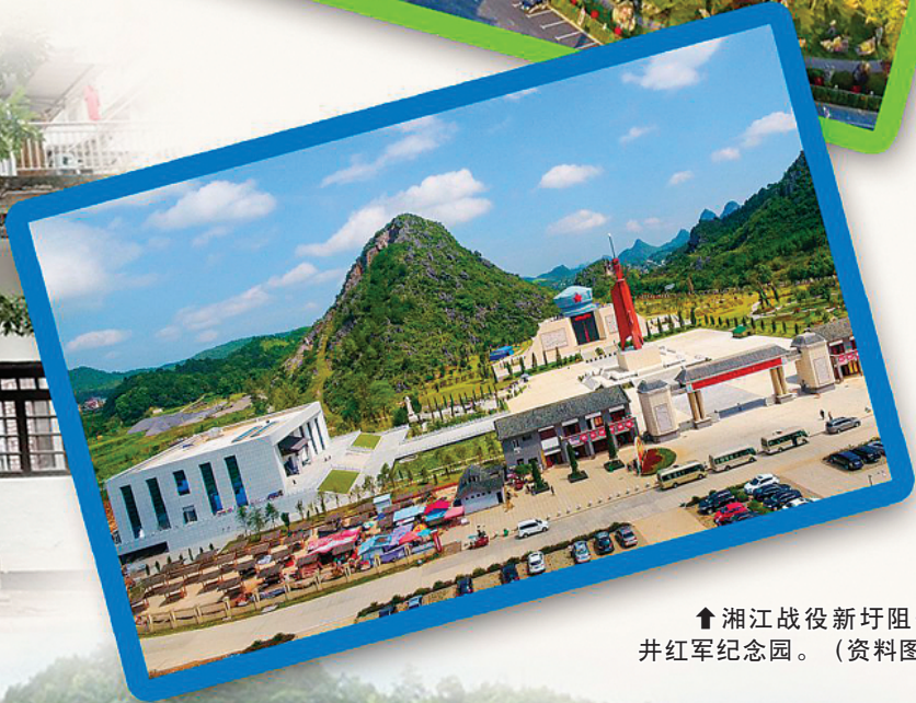
↑ 湘江战役新圩阻击战酒海井红军纪念园。(资料图片)