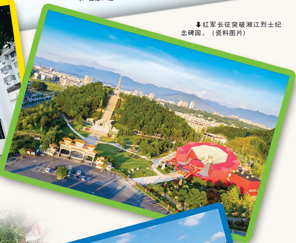
↓ 红军长征突破湘江烈士纪念碑园。