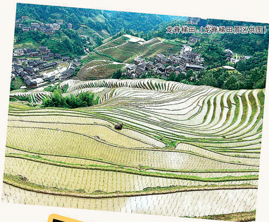
龙脊梯田。