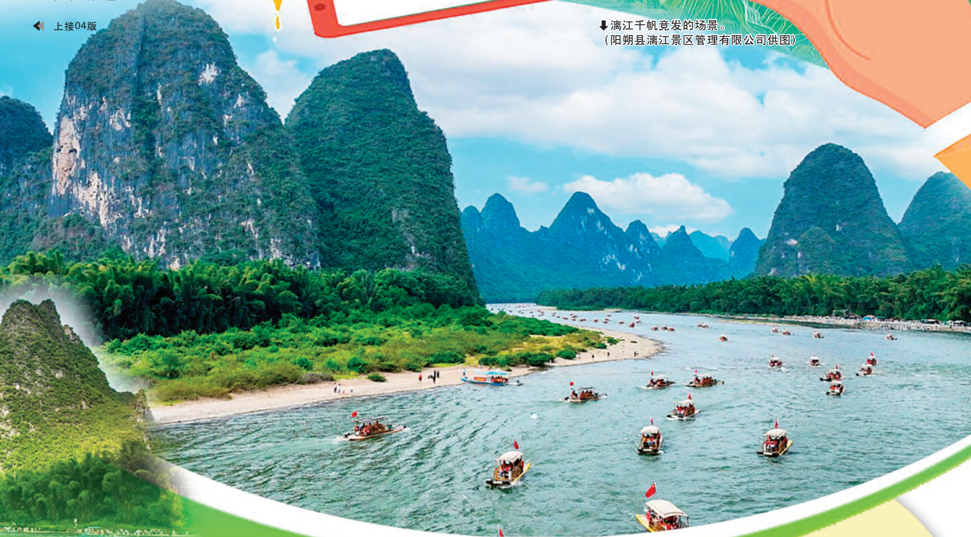
↓漓江千帆竞发的场景。