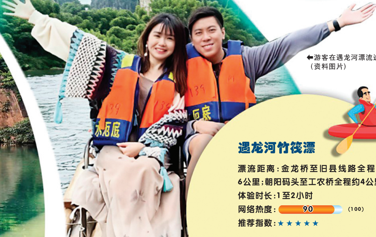
◀游客在遇龙河漂流途中与山水合影。 (资料图片)