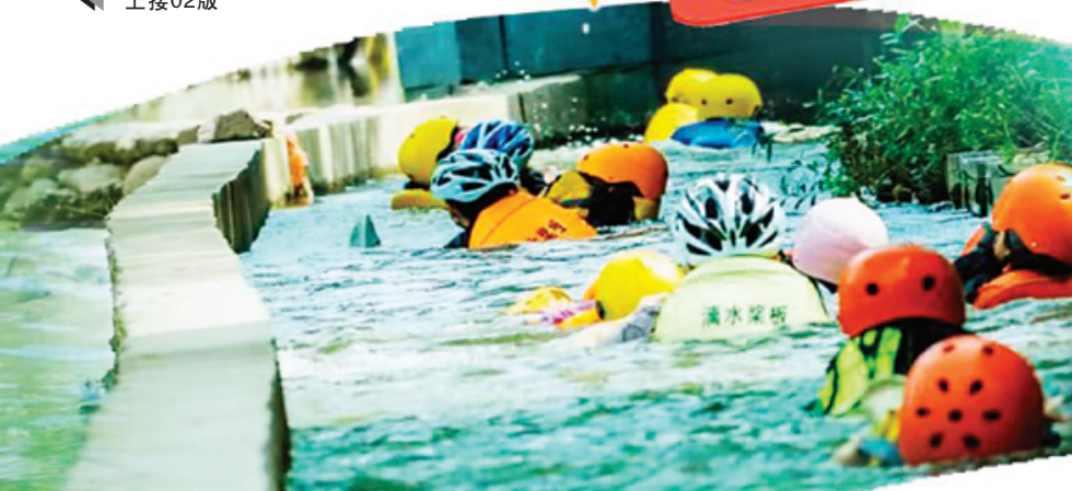
→ 游客参与东漓古村的“窝囊漂”。