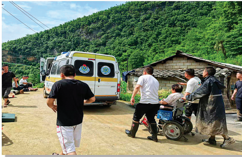
↑5月22日，救援人员在贵州省大方县果瓦乡庆阳村转移群众。

5月22日3时许和9时许，贵州省大方县长石镇和果瓦乡庆阳村分别发生一起山体滑坡。长石镇山体滑坡2名被困人员已找到，均已遇难。果瓦乡庆阳村山体滑坡有19人被困。事件发生后，当地公安、武警、应急、消防等部门已相继到达现场开展搜救工作。