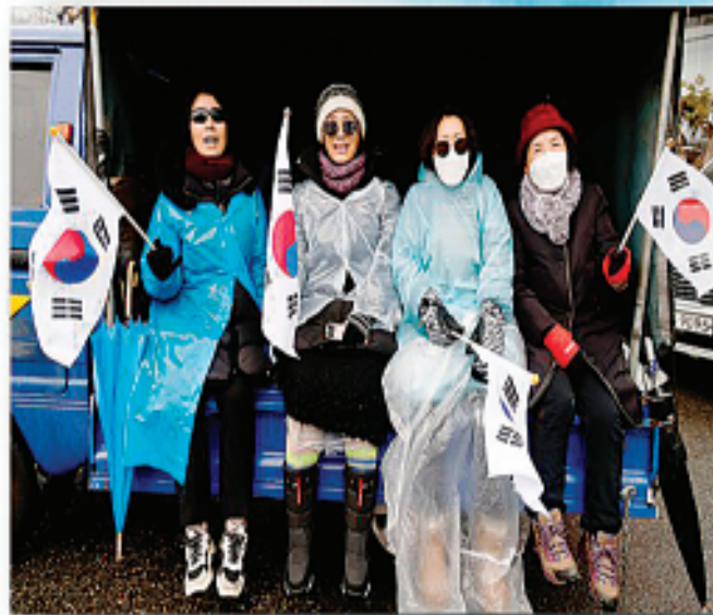
↑1月5日,尹锡悦支持者在位于韩国首尔的总统官邸附近参加集会反对逮捕总统尹锡悦。 新华社发