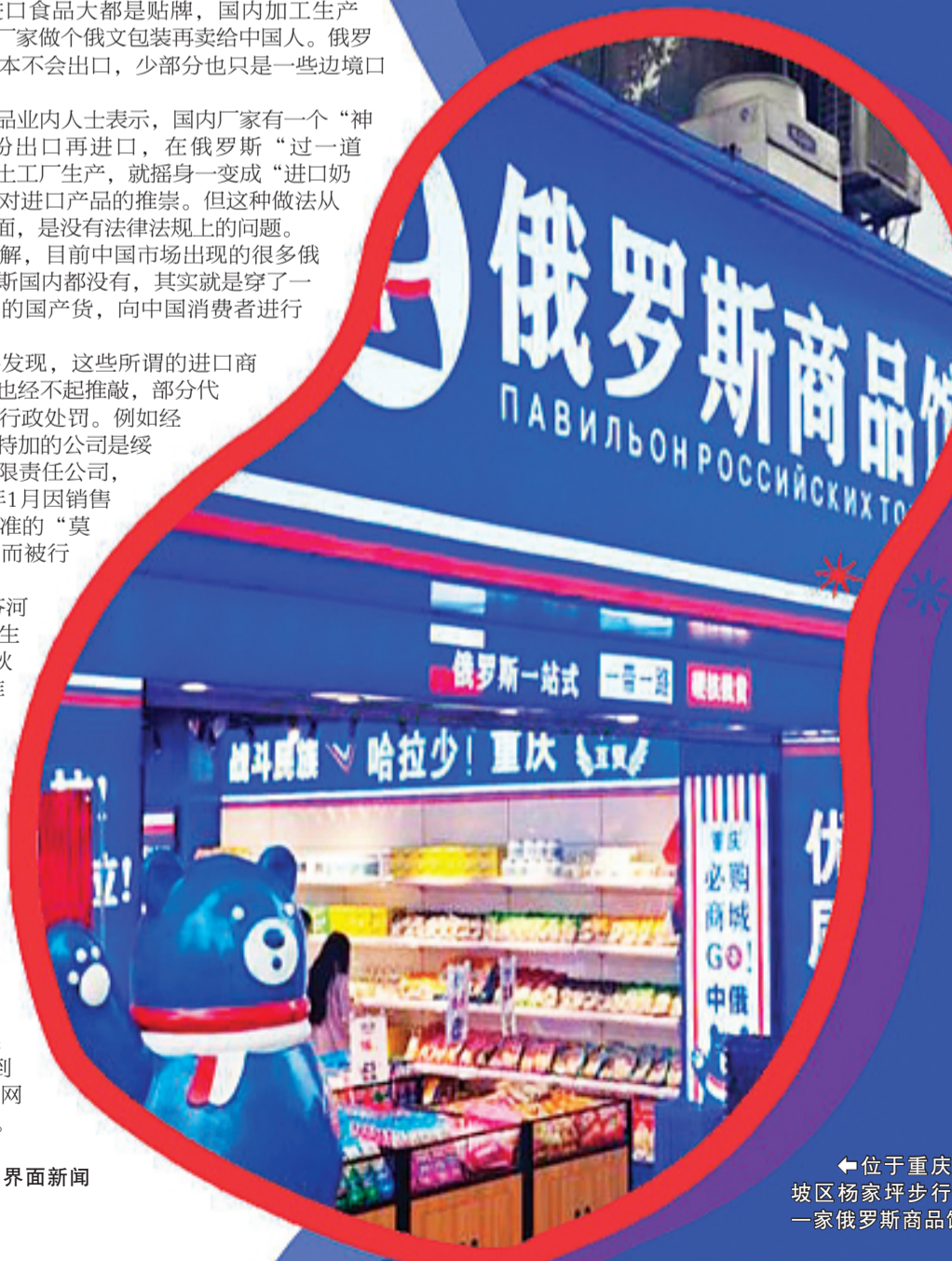
←位于重庆九龙坡区杨家坪步行街的一家俄罗斯商品馆。