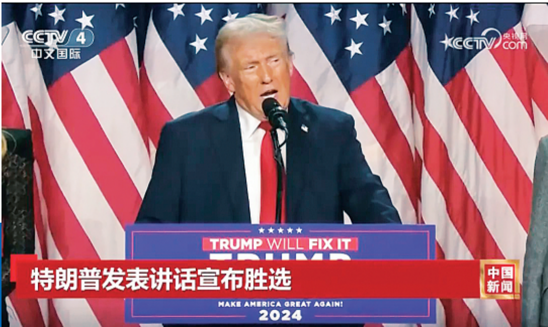
↑特朗普宣布胜选。

美国现任副总统、民主党总统候选人哈里斯6日在华盛顿特区发表讲话，承认自己在2024年总统选举中败选，并呼吁和平权力交接。 哈里斯发表讲话的地点，选在了她的母校霍华德大学。“我知道大家现在有各种各样的情绪，我理解。但我们必须接受这次选举的结果。” 哈里斯在约12分钟的讲话中说，她已经致电特朗普祝贺他胜选，“我还告诉他，我们会协助他及其团队的过渡，以实现权力的和平交接”。 如美国媒体此前预测，此次大选的悬念集中在宾夕法尼亚、北卡罗来纳、佐治亚、亚利桑那、内华达、威斯康星、密歇根七大“摇摆州”。目前亚利桑那和内华达计票工作仍在继续，但特朗普在其他五州的得票率均超过哈里斯。 当天早些时候，美国总统拜登先后与哈里斯和特朗普通话。他祝贺特朗普胜选，承诺权力交接的平稳过渡，并强调了努力促进国家团结的重要性。 白宫说，拜登还邀请当选总统特朗普到白宫与他会面，工作人员将协调近期的具体日期。拜登7日将就大选结果发表全国电视讲话。另据《卫报》报道，白宫还表示，在7日的讲话中，拜登预计将谈及总统选举结果和权力过渡。 对于哈里斯致电祝贺，特朗普竞选团队发表声明说，“哈里斯副总统在整个竞选过程中展现了力量、专业和坚韧，双方都同意团结国家的重要性”。