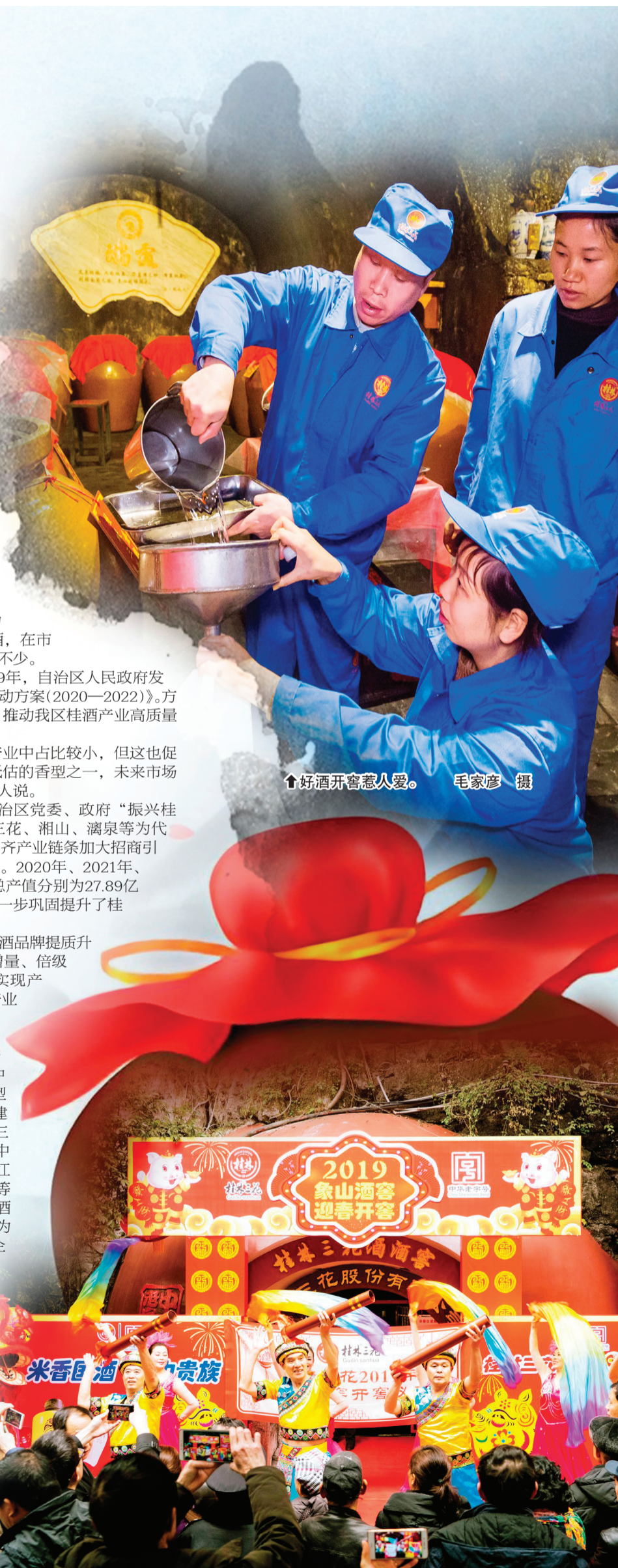
↑好酒开窖惹人爱。