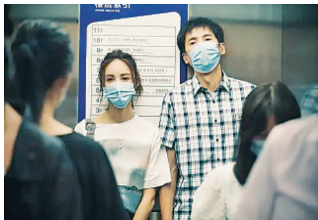
《又是充满希望的一天》剧照。