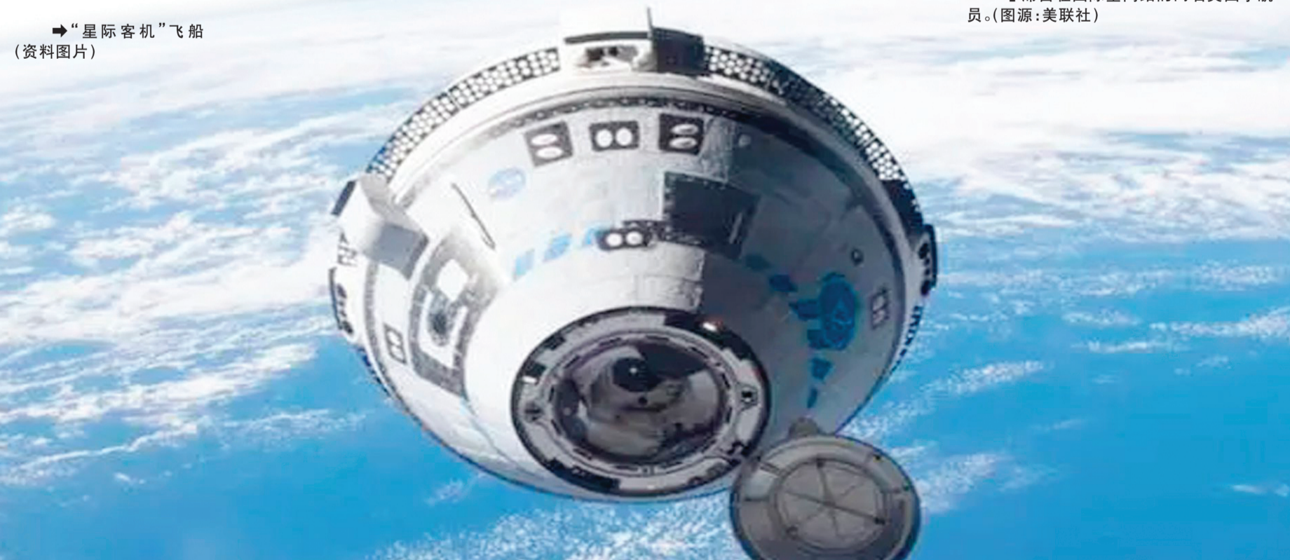
→“星际客机”飞船 (资料图片)