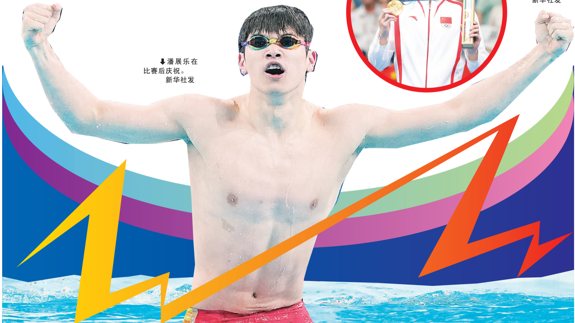
↓ 潘展乐在比赛后庆祝。