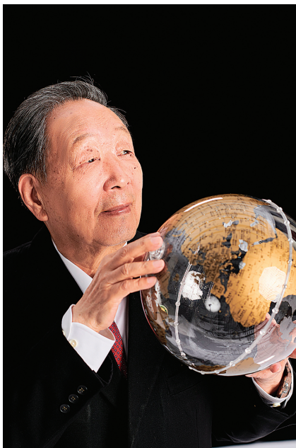
2024年5月13日在武汉大学拍摄的李德仁肖像。

空遥感再到卫星遥感，再到通信、导航和遥感一体融合……在中国人“巡天问地”的征程上，李德仁仍未停步。