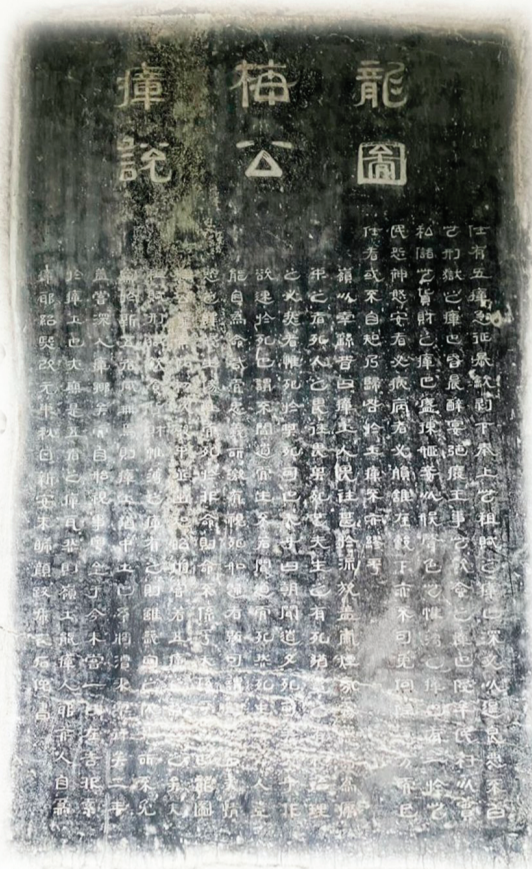
↑《龙图梅公瘴说》石刻。

历经800多年的风雨洗礼，《龙图梅公瘴说》石刻依然屹立于桂林龙隐岩，熠熠生辉。它不仅是对古代廉政文化的传承与弘扬，更是对现代人心灵的洗礼与启迪。每当游客驻足观赏，都能深切感受到其中蕴含的深厚文化底蕴与崇高精神追求。1963年，郭沫若曾到此一游，并留下“梅公瘴说警人心”的诗句，足见其对这一石刻的极高评价与深刻认识。