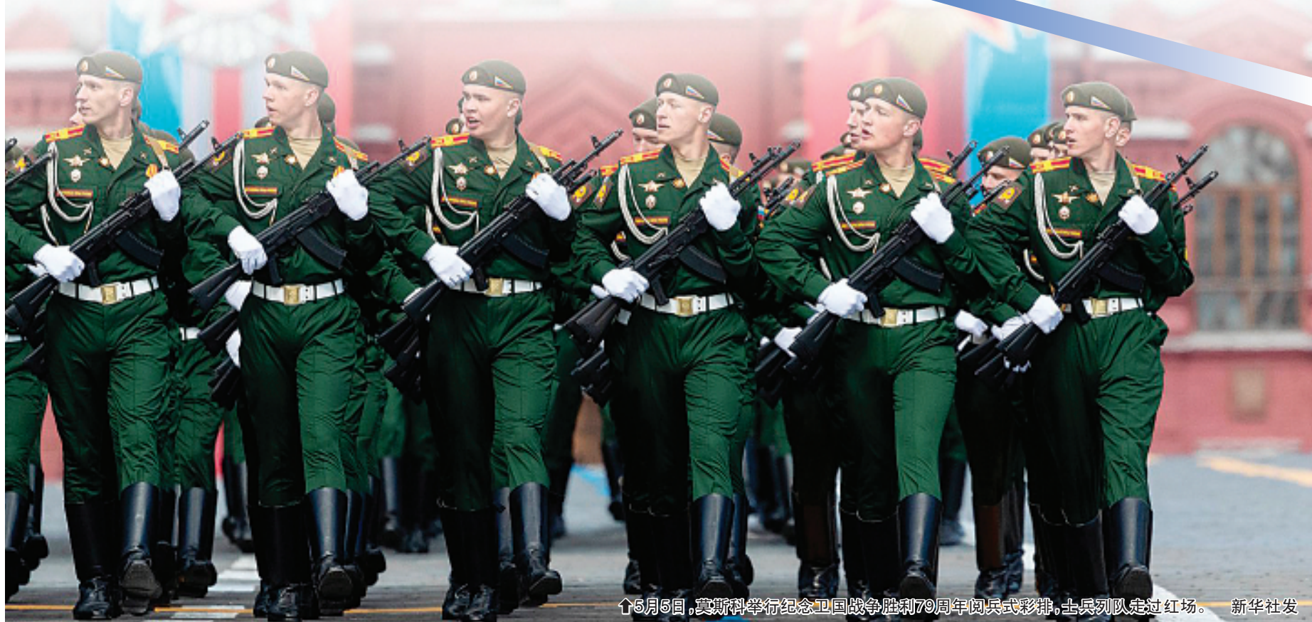
↑5月5日，莫斯科举行纪念卫国战争胜利79周年阅兵式彩排，士兵列队走过红场。