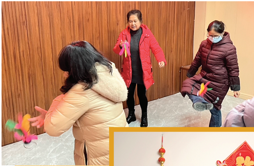
←融和社区居民参加游园活动。