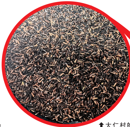
↑大仁村的紫金米。 (资料图片)

在白竹村委党群服务中心，可以看到积分兑换超市，超市里有各类生活用品以及东山瑶乡的土特产。据介绍，这是村委制定的积分兑换奖励制度，根据村民们的表现、村委的评议，村民每个季度可以根据自己的积分来兑换奖励。