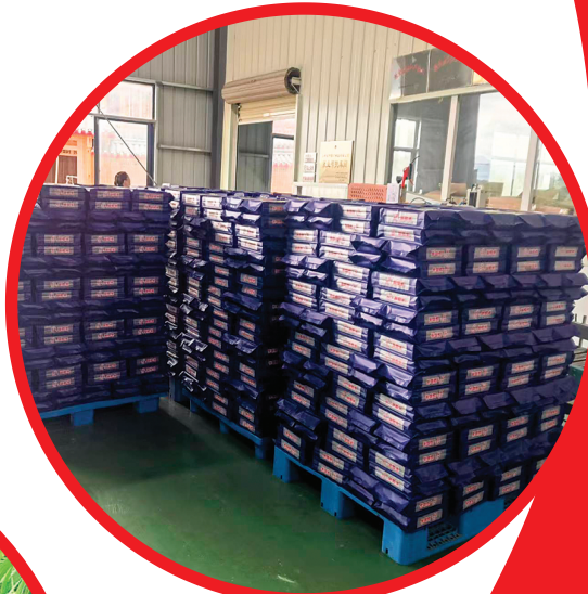
↑包装好的紫金米。 (资料图片)