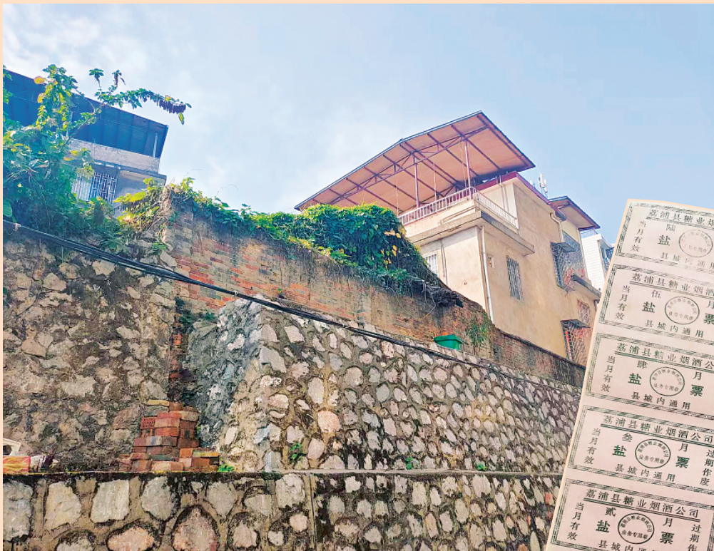
↑现在盐业小区里还保留着一段过去盐仓的围墙。

盐业小区位于中山北路102号，是叠彩区北门街道锦绣社区的一个无物业小区，这里居住着102户居民。坐在小区的大榕树下，倾听老盐业人对往昔的回忆，有辛苦、有汗水、有激情，更有盐业人满满的骄傲。