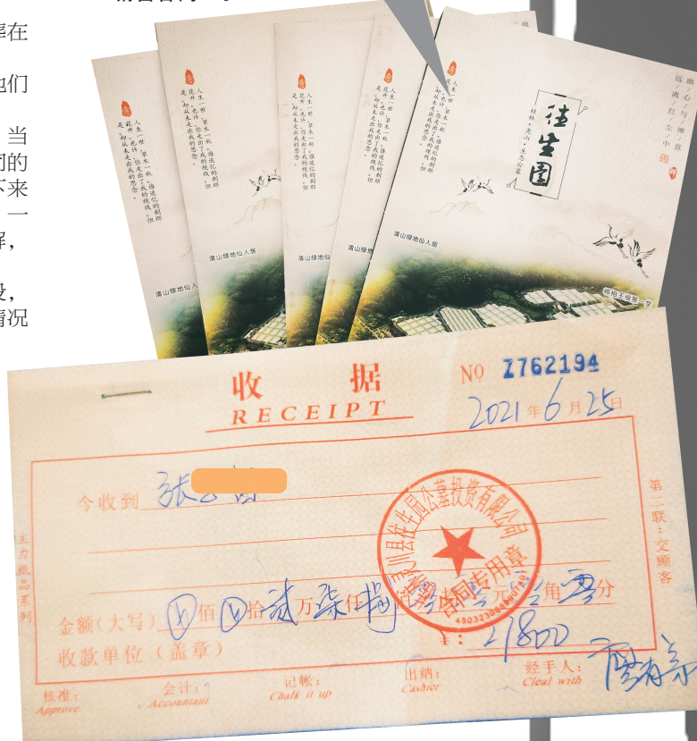
↑张先生的购买收据。