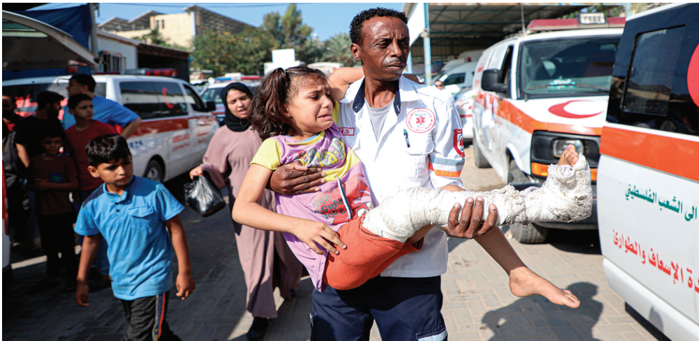
↑1日，在拉法口岸加沙一侧，医护人员搬运一名受伤人员。

中国社科院西亚非洲研究所研究员余国庆在接受记者采访时表示，在当前巴以冲突持续的背景下，开放拉法口岸允许持外国护照的人员和急需救治的伤员离开加沙，无疑是一个令人略为宽慰的消息。但这种开放能持续多久，有多少人能够离开加沙，仍具有很大的不确定性。