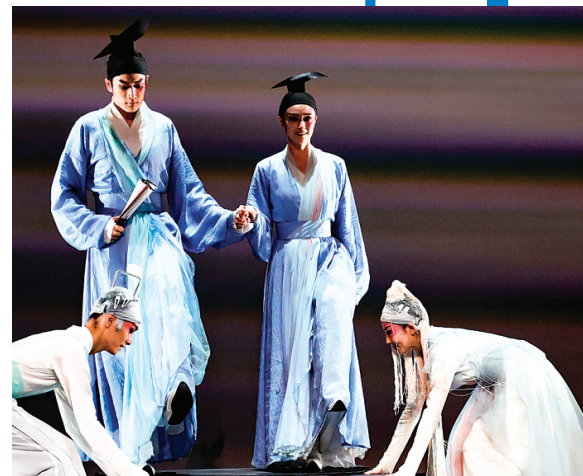
↑→《梁祝》 演出剧照。 记者李凯 摄