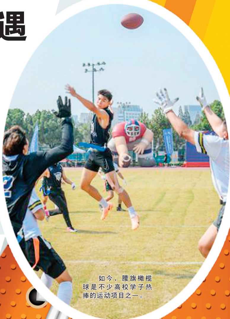
如今，腰旗橄榄球是不少高校学子热捧的运动项目之一。