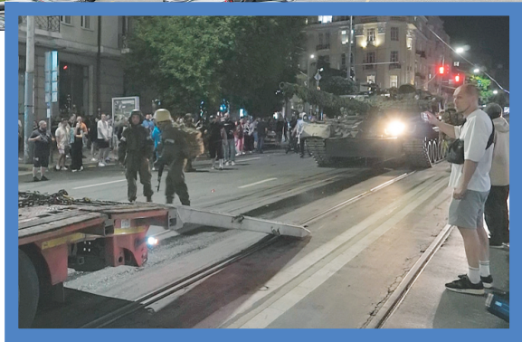
← 6月24日，在俄罗斯顿河畔罗斯托夫，坦克准备装车撤离（视频截图）。 新华社发