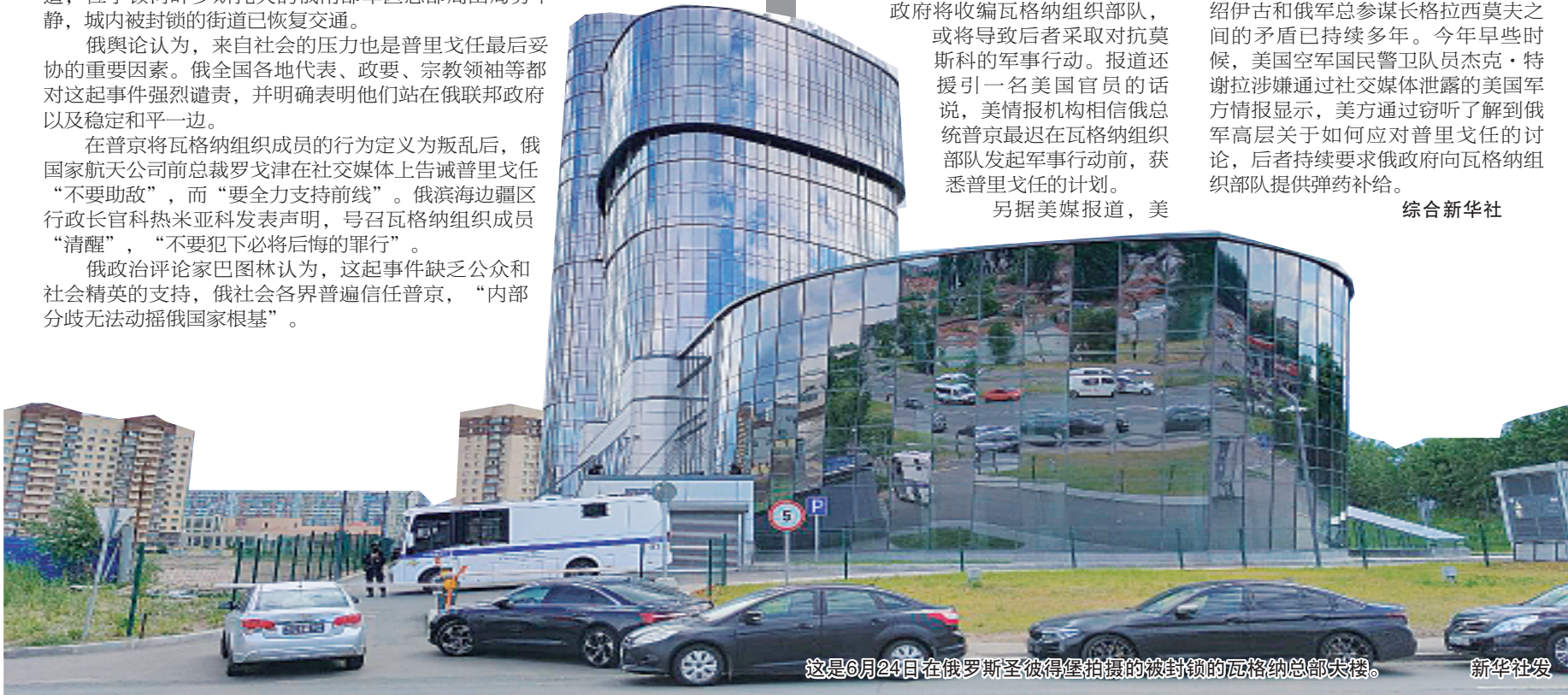
这是6月24日在俄罗斯圣彼得堡拍摄的被封锁的瓦格纳总部大楼。