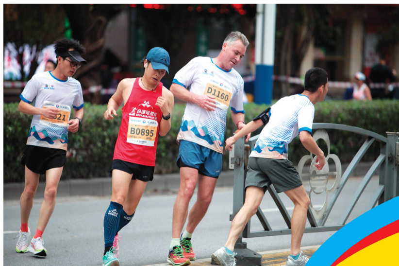
↑选手向赛道旁的市民热情挥手。